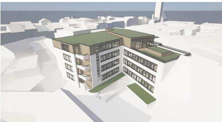
Modellansicht Neubau am Westlichen Stadtgraben 4 in Deggendorf