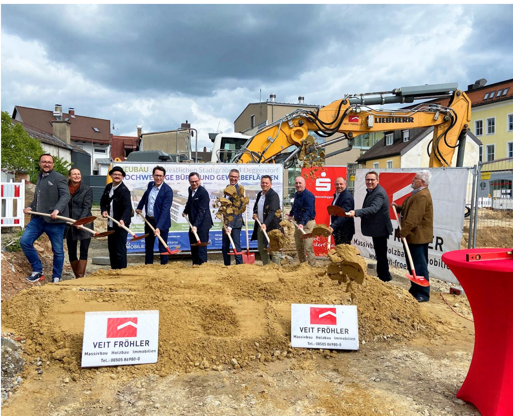
Spatenstich am Westlichen Stadtgraben 4 in Deggendorf, 17.05.2023